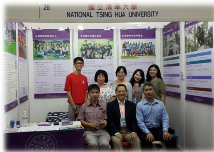
本校團員與在校工讀生(後排名)、即將入學新生(後排左)及前來協助之校友(前排左、右)合影(檳城場次)