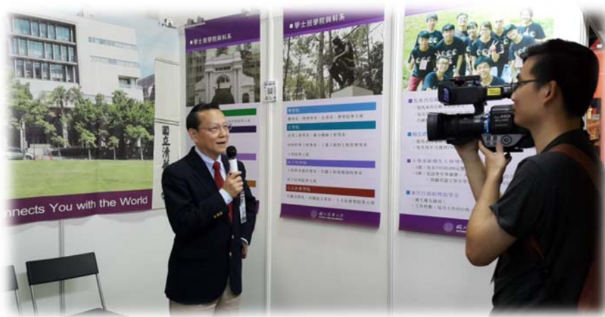
蔣副全球長於攤位受訪