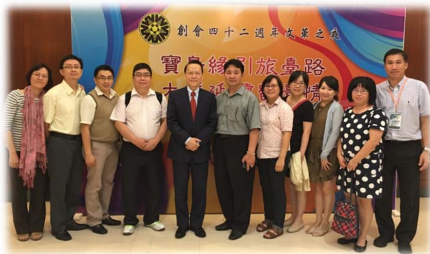
吉隆坡文華之夜與本校校友(中為蔣副全球長及高順發會長)相聚，合影留念